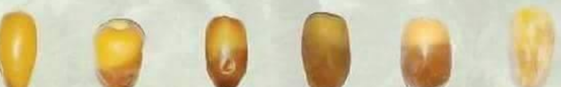
سلج Sullaj سكري Sukkari سري Sari سباكة Sabaka روثانة Ruthana رشودية Rushodia