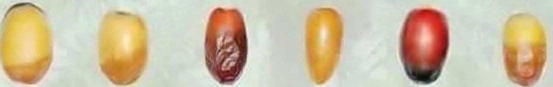
رزيز Ruzeiz ربعة Rabeaa ذاوي Thawee دقلة نور Deglet Noor خنيزي Khenaizy خلاص Khalas