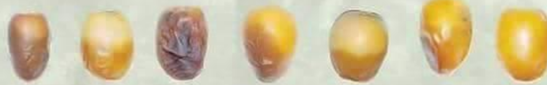
ونانة Wannana هلاي Hilali نبتة علي Nabtat Ali نبتة سيف Nabtat Seif نبتة سلطان Nabtat Sultan مئيفي Meneifi مكتومي Maktomi