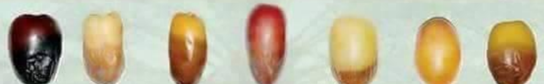
عجوة Ajwa صقعي Segae صفري Sefri صفاوي Safawi شيشي Shaishee شهل Shahal شبيبي Shebebi