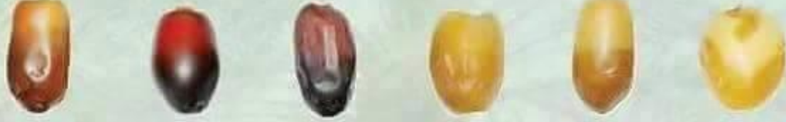
خضري Khodry خصاب Khesab حلوۃ Hulwa بيض Beid برني المدينة Barni Al Madina برحي Burhi