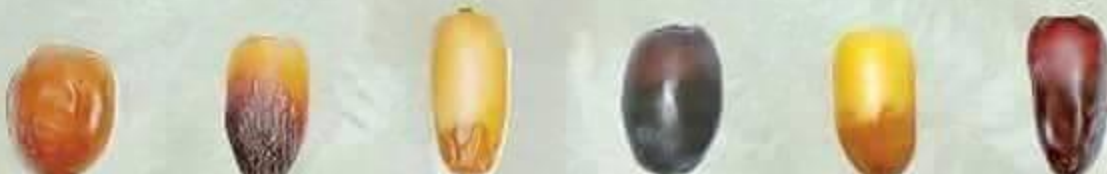
مسكاني Miskani مجهول Majhool مبروم Mabroom قطاره Qatarah غر Ghur عنبره Anbara